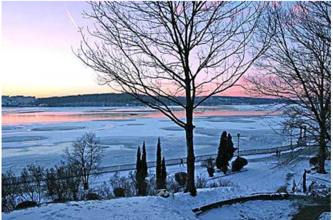
Мал. 2.1. Тернопільський став

Контроль за станом р. Серет Тернопільського водосховища проводився 15 лютого 2018 року Тернопільським обласним управлінням водних ресурсів від створу, який знаходиться в м.Тернопіль 180 км (Тернопільське водосховище).