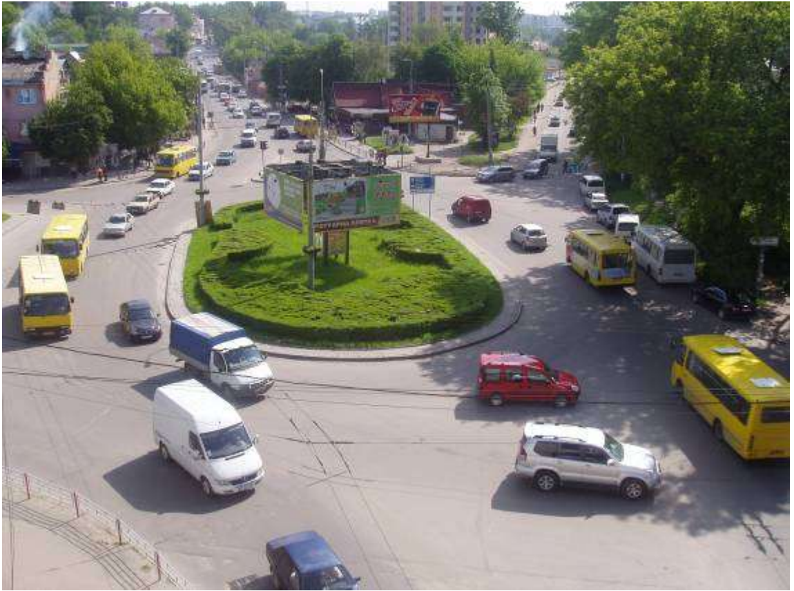
Транспортна розв'язка вулиць Збарзької, Бродівської, Галицької у м. Тернопіль (стаціонарний пост спостереження за станом атмосферного повітря № 1)